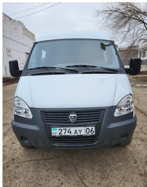
Пассажирский автобус 15+1